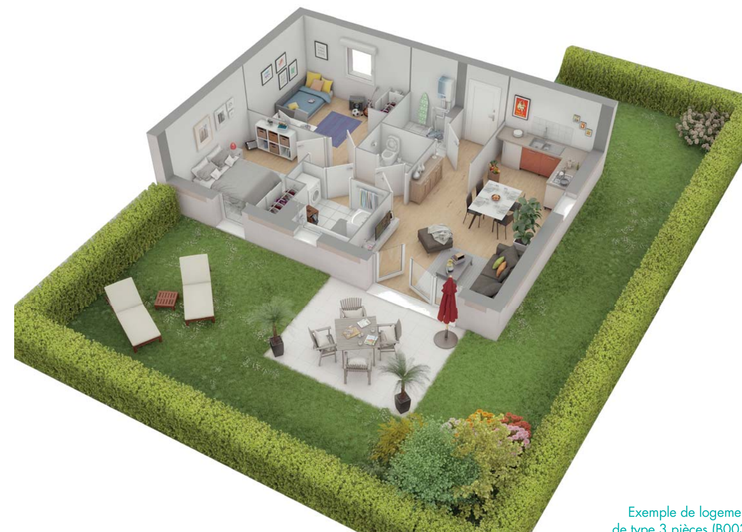
Exemple de logement de type 3 pièces (B003)

NATURIA s'inscrit dans un style architectural typique du Bassin d'Arcachon, celui-là même qui évoque les vacances... Des modénatures de briquettes en façade, des barreaudages en bois et des enduits aux couleurs douces forment un ensemble harmonieux, parfaitement intégré. Les toitures à pans inclinés, couvertes des traditionnelles tuiles de Gironde ou de Marseille, ont été soigneusement dessinées pour parfaire l'ensemble.